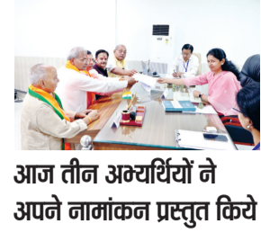
आज तीन अख्यर्थियों ने अपने नामांकन प्रस्तुत किये