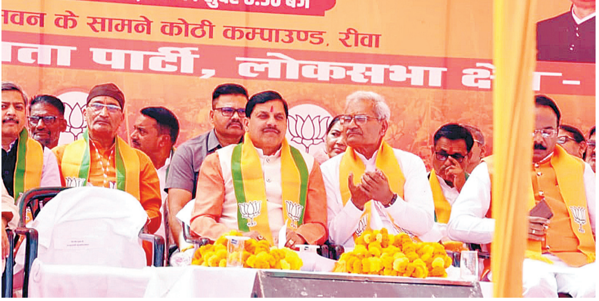
जिस पार्टी ने राम मंदिर का आमंत्रण टुकराया, अब जनता उसे टुकराएगी